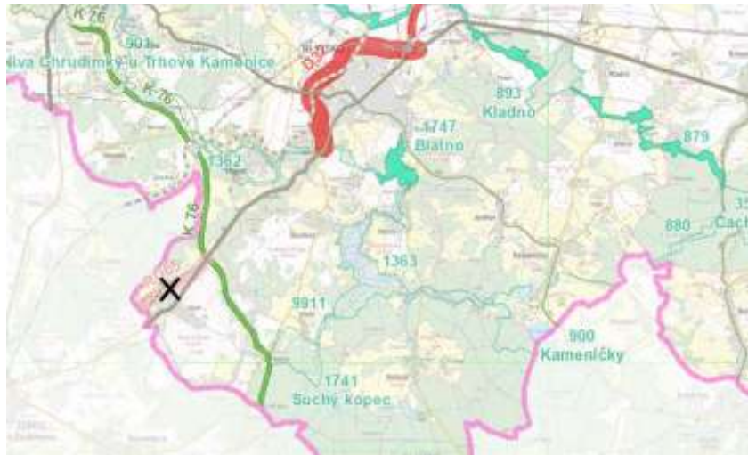
obrázek 5 – výřez ZÚR Pk s vyznačením rušené územní rezervy (pracovní podklad KrÚ)