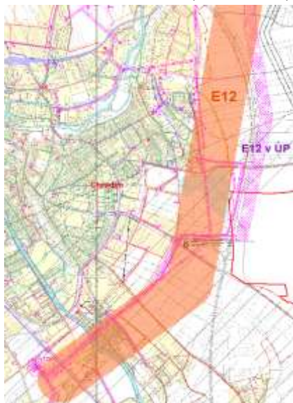
obrázek 6 - koridor E12 ze ZÚR Pk zobrazený nad Územním plánem Chrudim (pracovní podklad KrÚ)