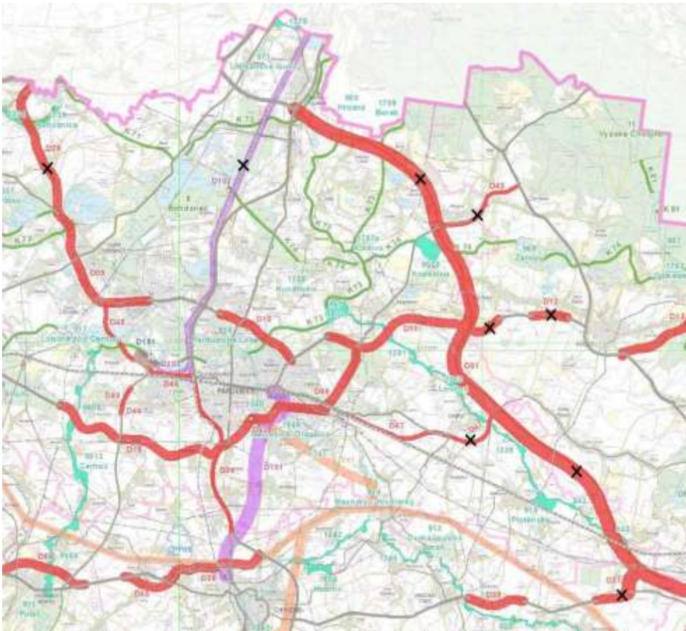
obrázek 1 – výřez ZÚR Pk s vyznačením rušených koridorů (pracovní podklad KrÚ)