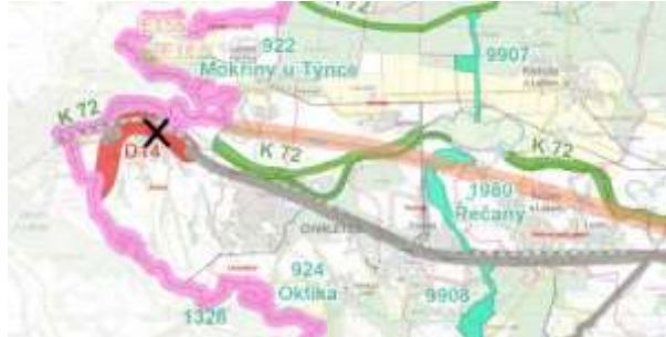
obrázek 3 – výřez ZÚR Pk s vyznačením rušené části koridoru (pracovní podklad KrÚ)