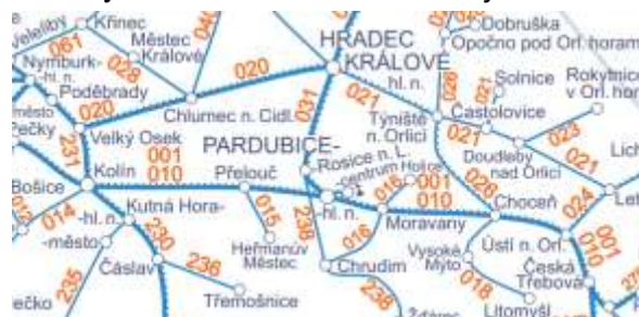
obrázek 8 – mapa železniční sítě