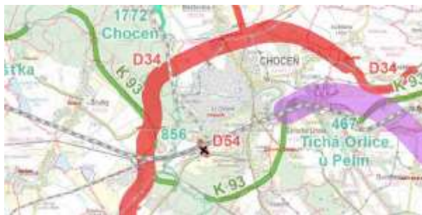
obrázek 4 – výřez ZÚR Pk s vyznačením rušeného koridoru (pracovní podklad KrÚ)