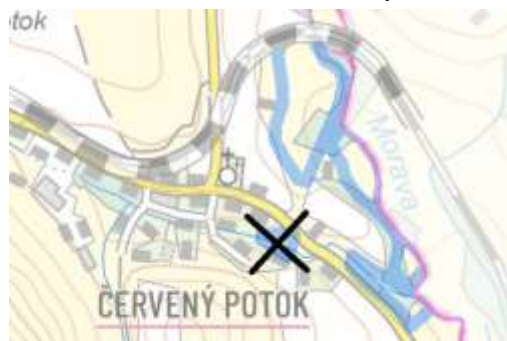
obrázek 7 – rušený polygon z protipovodňového opatření (pracovní podklad pořizovatele)